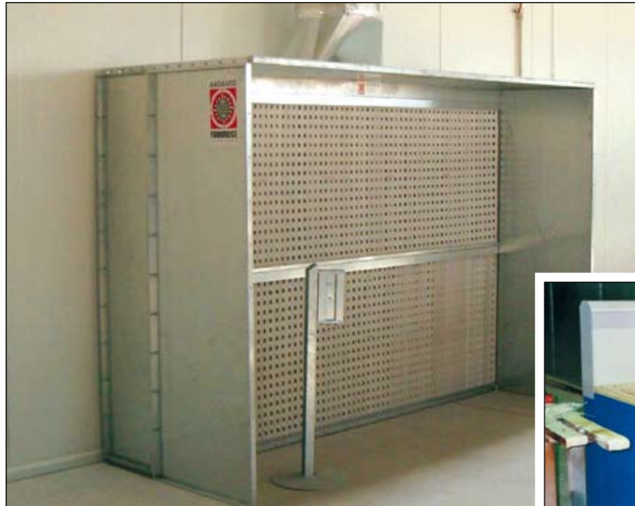
Шлифовальный стол с автономной вытяжкой и двумя фильтрами внутри стола.

Фирма Aagaard предлагает в своей программе также сухие стенки для покраски с фильтром Andre.